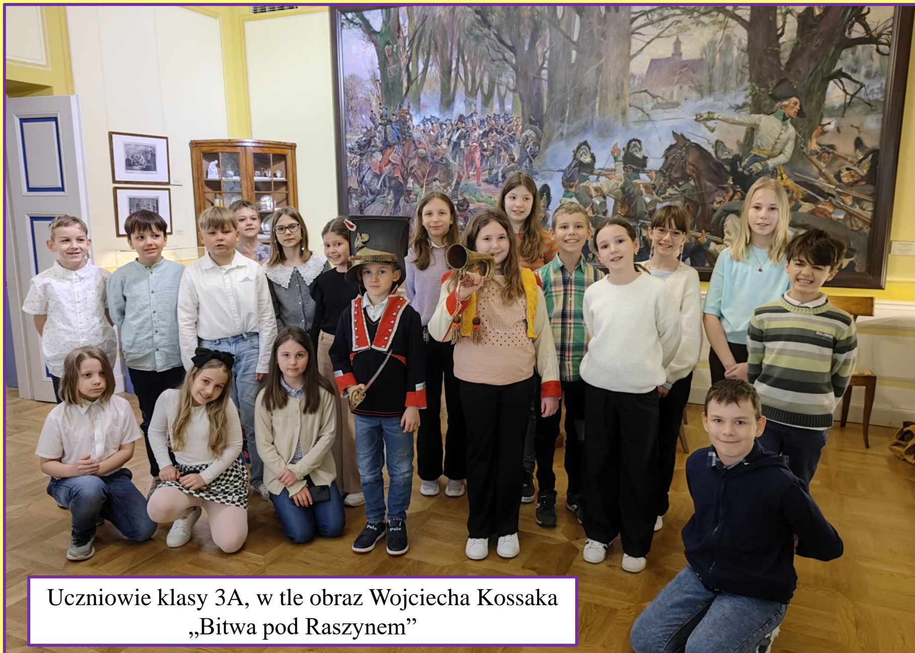
Uczniowie klasy 3A, w tle obraz Wojciecha Kossaka „Bitwa pod Raszynem”